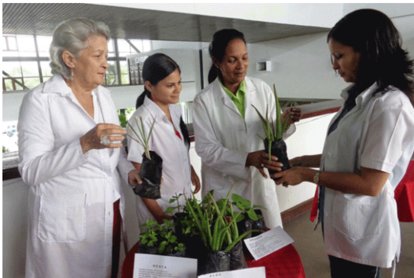
Medicina Natural Tradicional.