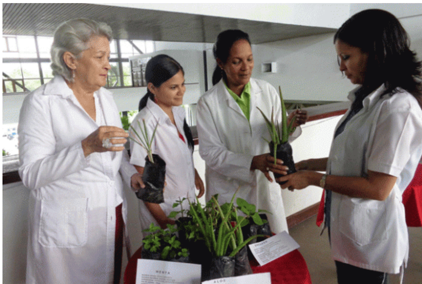
Medicina Natural Tradicional.